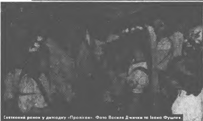
Святковий ранок у дитсадку «Пролісок».

20 травня Сонце вступить в зодіакальний знак Близнят.